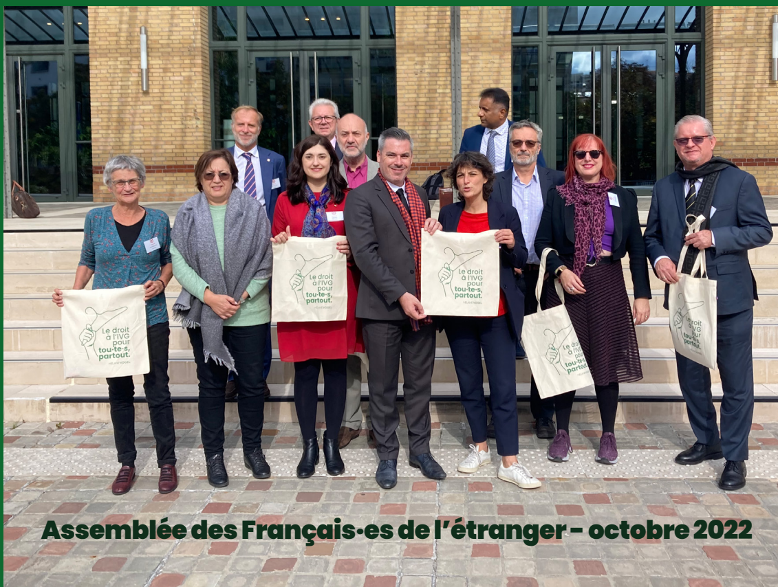
Assemblée des Français-es de l'étranger - octobre 2022