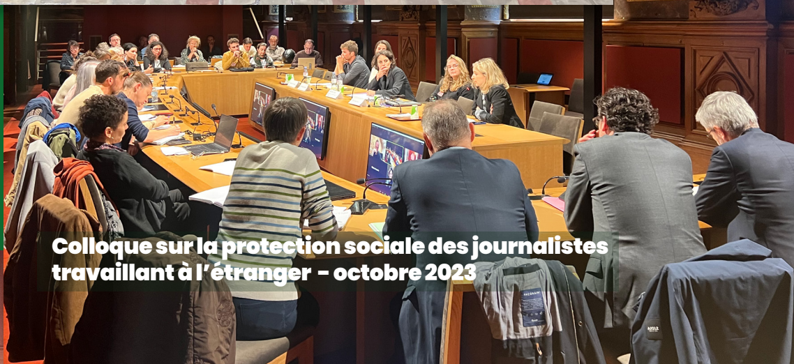
Colloque sur la protection sociale des journalistes travaillant à l'étranger - octobre 2023