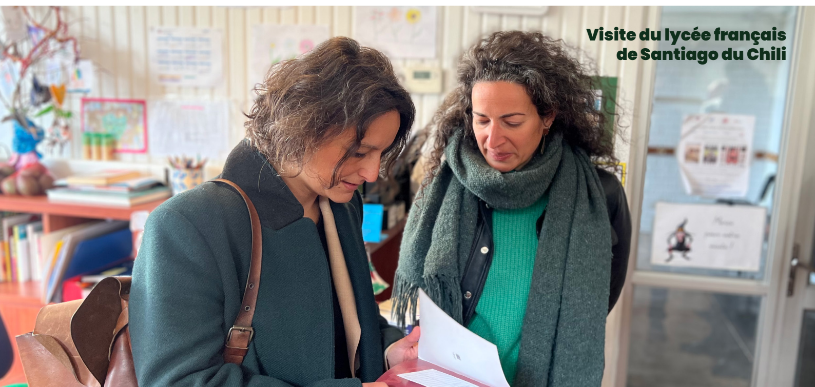
Visite du lycée français de Santiago du Chili

Je reste vigilante sur les déconventionnements (par exemple en Espagne) et sur les suites données aux consultations sur l'enseignement français à l'étranger. J'ai, enfin, alerté l'administration et l'opinion publique lors de cas d' agressions sexuelles dans le réseau d'enseignement , notamment au Lycée français de Barcelone, et j'ai interpellé le gouvernement pour qu'enfin soit mis en place un protocole, clair et efficace, de prise en charge des victimes dans le réseau AEFE.