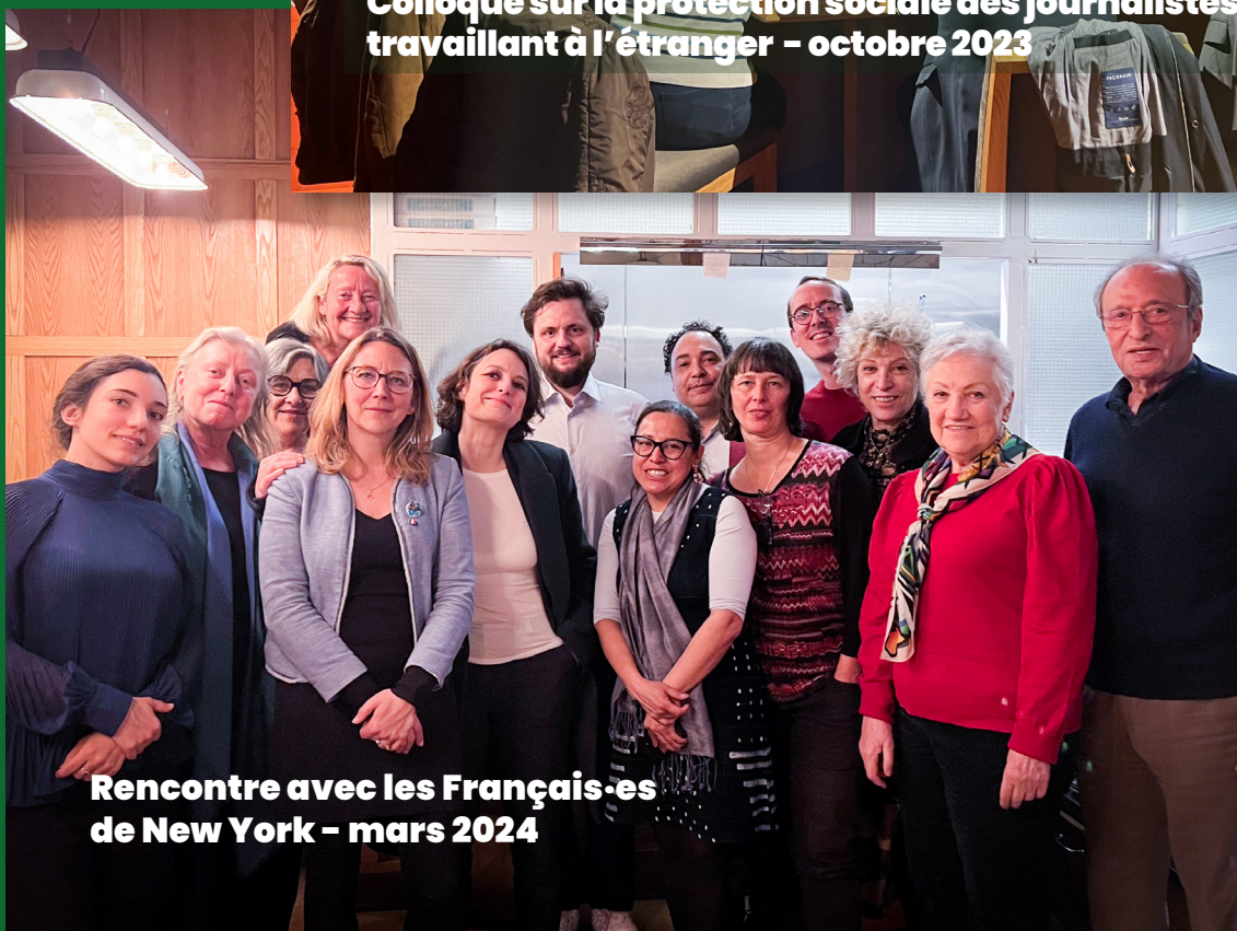
Rencontre avec les Français-es de New York - mars 2024